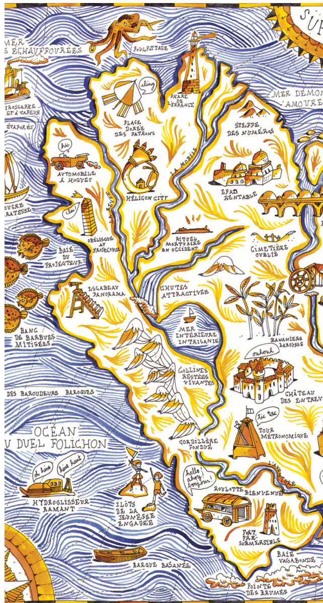
ILLUSTRATION • ART IMPRIMÉ